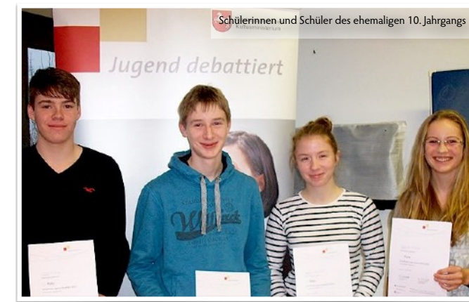
Schülerinnen und Schüler des ehemaligen 10. Jahrgangs