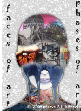
© N. Brennecke & L. Konecke